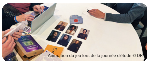
Animation du jeu lors de la journée d'étude