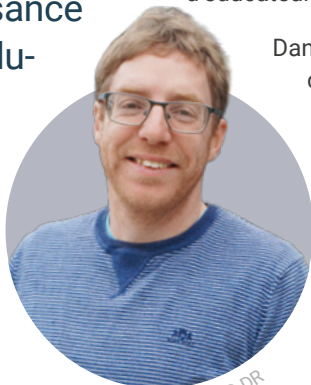
Benoît Nicolaes © DR

En février dernier, Entrées libres consacrait son dossier au métier d'éducateur spécialisé, des professionnels indispensables, mais encore trop méconnus, même au sein des écoles qui les emploient. On y traitait de l'évolution du métier, voire de sa révolution au cours des cinquante dernières années, du manque de reconnaissance dont souffrent beaucoup d'éducateurs – souvent lié à un manque de connaissance du métier tout court – ou encore de son absence assez inexplicable dans le fondamental, sauf exceptions. Pour ce second dossier, on a décidé de quitter les constats pour se rendre sur le terrain. Se glisser dans le quotidien du Collège Don Bosco de Woluwe-Saint-Lambert, où éducateurs du fondamental et du secondaire coexistent, et de plus en plus, travaillent ensemble.