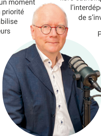
Alexandre Lodez ©DR

Pour permettre aux élèves de trouver du sens, l'école chrétienne met en avant l'importance du dialogue entre foi et raison, entre tradition et innovation. Les enseignants sont appelés à accompagner les jeunes dans leur quête de sens en leur proposant des outils pour analyser, comprendre et dépasser les enjeux contemporains. Il s'agit de leur offrir un horizon d'espérance, une capacité à rêver et à construire leur avenir en lien avec leurs valeurs personnelles et spirituelles.