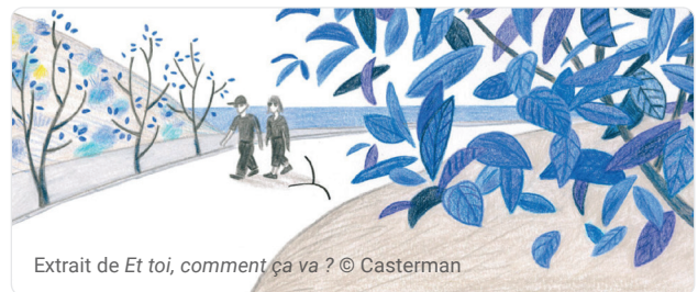
Extrait de Et toi, comment ça va ?